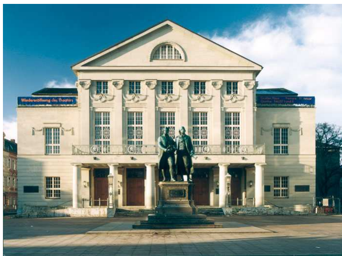
Niemiecki Teatr Narodowy w Weimarze 29 sierpnia 2011 r.

Wybór Weimaru na miejsce powołania Trójkąta miał wyrażać, że ta Europa, ta nowa Europa jest czymś więcej niż tylko wspólnotą gospodarczą, że tym, co nas łączy, jest wspólna europejska kultura, którą współtworzyły wszystkie narody Europy. Hans-Dietrich Genscher